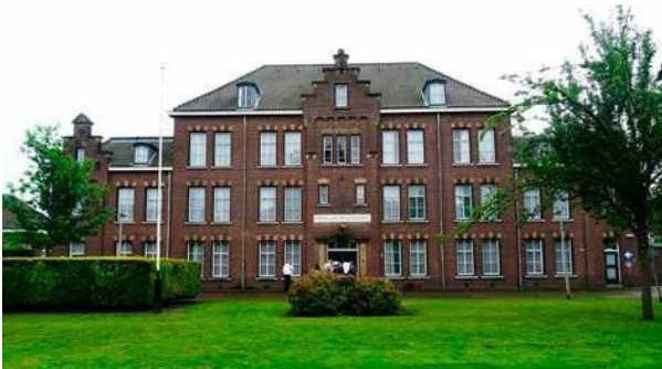
locatie in Maastricht – voormalige Kazerne Kon. Marechaussee