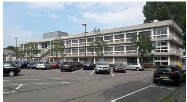
locatie in Leeuwarden – voormalig Belastingkantoor