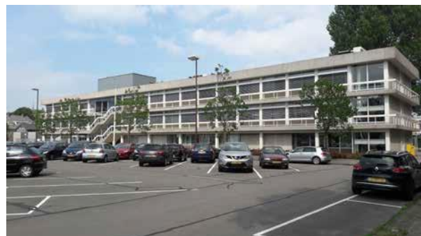
Beoogde locatie in Leeuwarden